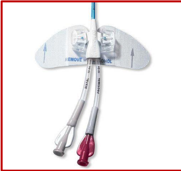
Εικόνα 1. Συσκευή σταθεροποίησης ΚΦΚ χωρίς ραφή